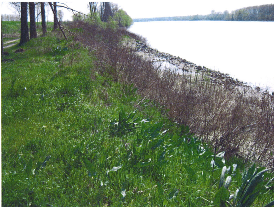
Veduta generale dell'area d'intervento