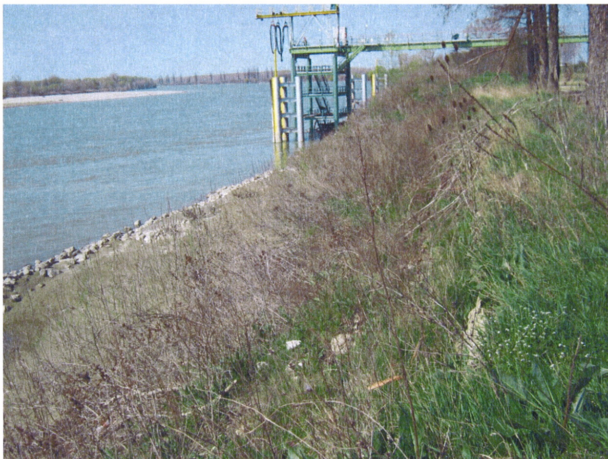
Vista della difesa e degli impianti presenti immediatamente a monte della zona d'intervento