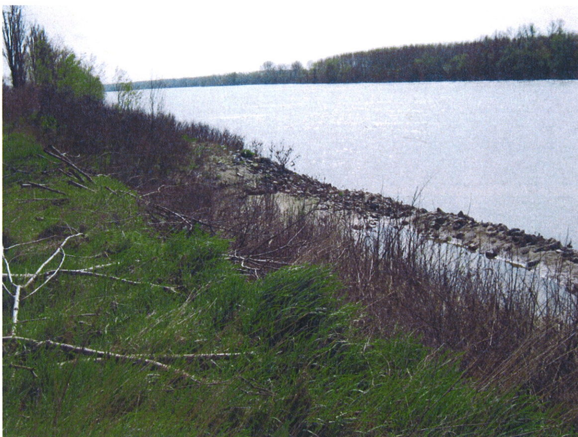
Particolare dello slittamento del terreno verso fiume